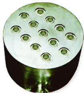
バーナーキャップ