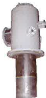
グラファイト製バーナー