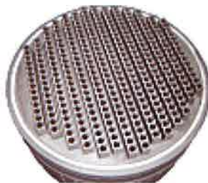
ディストリビューター